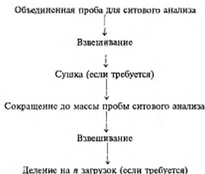
Рисунок 1 — Схема подготовки объединенной пробы к ситовому анализу

Рекомендуется иметь в наборе количество сит больше, чем требуется для определения контролируемых фракций во избежание перегрузки нижнего сита. При этом желательно, чтобы на верхнем сите оставалось не более 5 % ферросплава, а между любой парой сит — не более 25 % ферросплава.