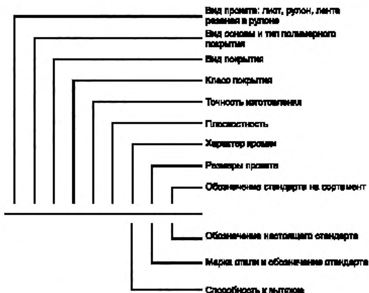
Схема условных обозначений проката с полимерным покрытием

Примечание — При отсутствии какого-либо из параметров его выбирает предприятие-изготовитель.